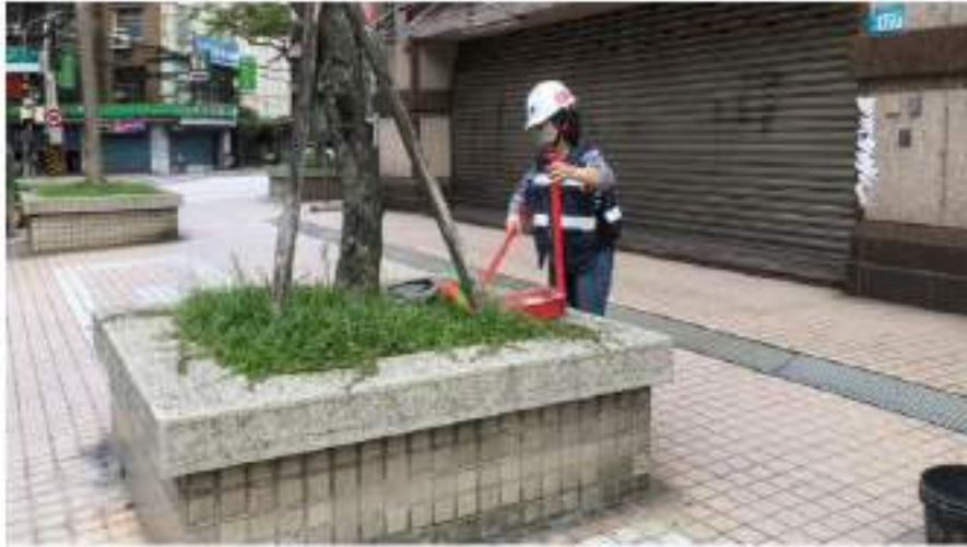
敦親睦鄰環境清潔