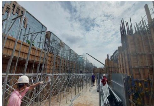
B.C棟室內施工排架搭設 賀成8/18