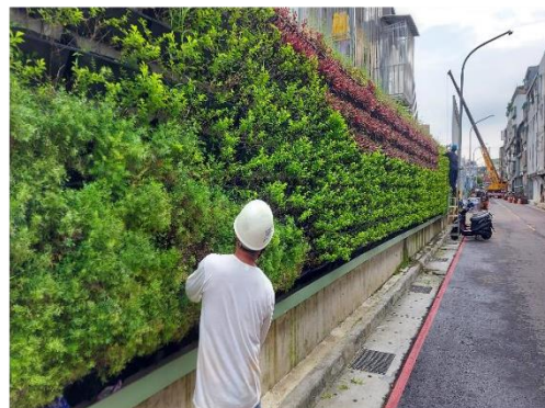
工區綠籬固定整理 鑫瑩 8/17