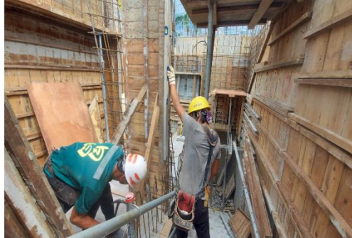
B棟1MF樑底模組立 城正8/18