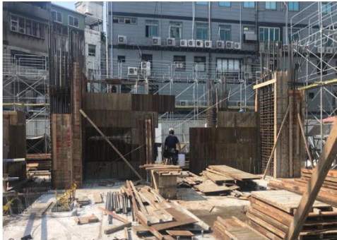
A棟1樓柱牆封模 麒麟7/29