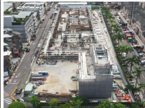
全區空拍 根基 8/17