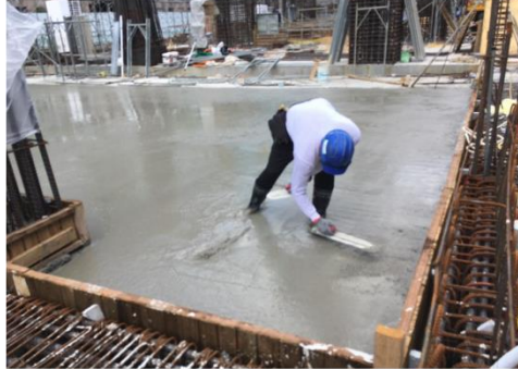
B, C區1樓版區粉光 眺鼎7/27