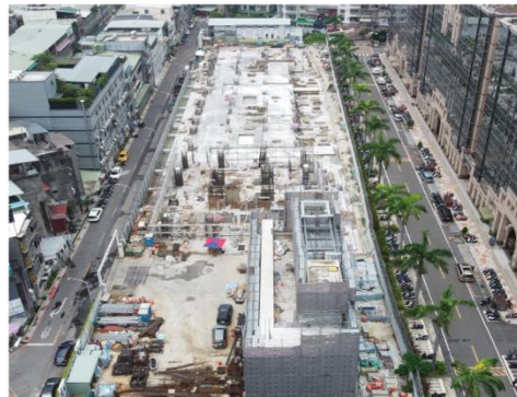
全區空拍照 根基 7/28