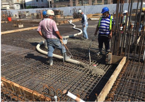
B, C區1樓版區澆置 祥英7/27