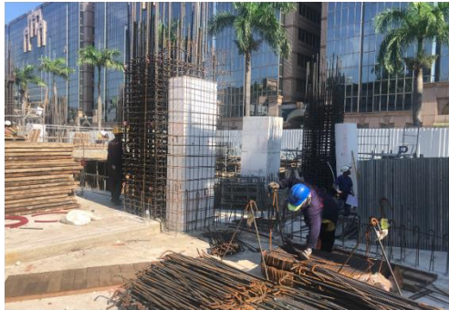
A區1樓柱筋綁紮 宏峻7/27